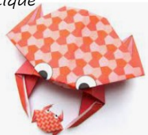
Origami : crabes et hippocampes