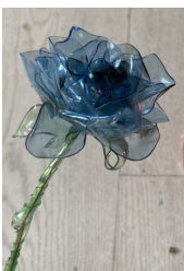
Roses en bouteille plastique